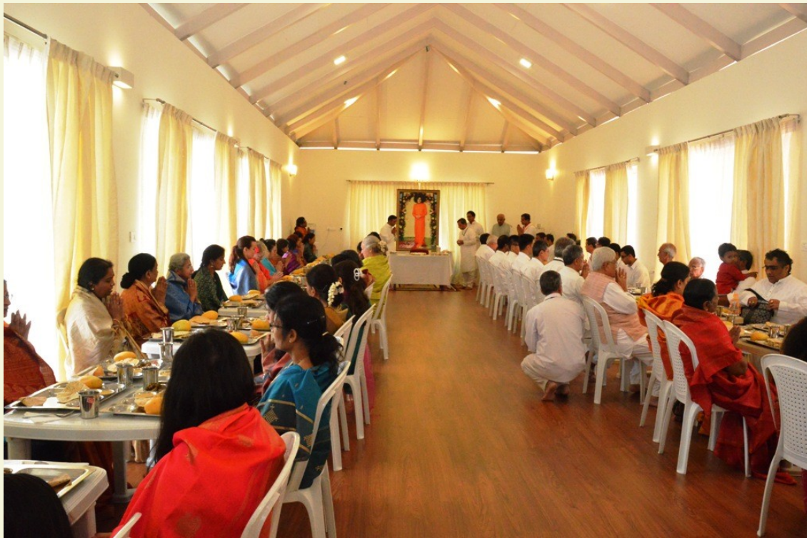
Kodai Kanal – Día 2, 15 de mayo de 2016